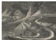
E-Pics Alte und Seltene Drucke Alte und Seltene Drucke ETH-Bibliothek, ca. 10'000 Bilder online