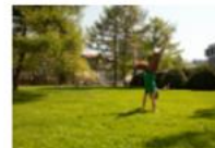
E-Pics Stab Veranstaltungen