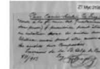
E-Pics Rostpilze der Zürcher Herbarien Rostpilze der Zürcher Herbarien (57'000 Belege online)