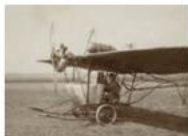
E-Pics Bildarchiv Online Bildarchiv ETH-Bibliothek, ca. 320'000 Bilder online