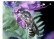
E-Pics Tiere, Pflanzen und Biotope ca. 20'000 Bilder online